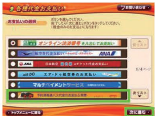
3: 「予約済高速バス代金のお支払&発券」をタッチ