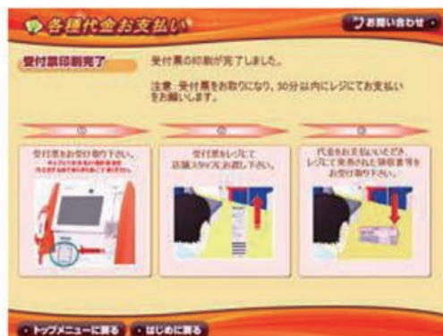
9: 本体から出力される「申込券」を取りレジにて30分以内にお支払下さい(現金のみ)