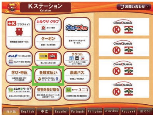
1: 「各種支払い」をタッチ