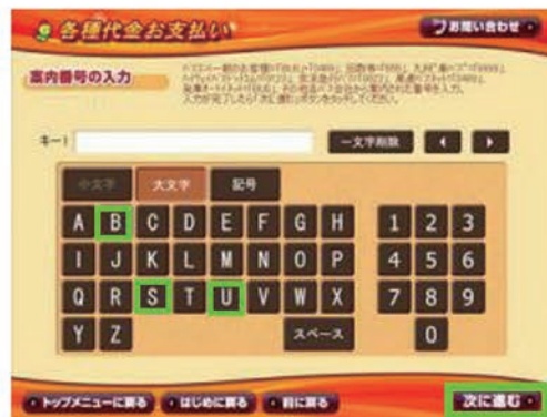
5: 「BUS」と入力し「次に進む」をタッチ