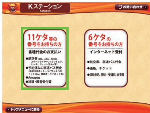
2: 「各種代金のお支払」をタッチ