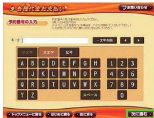
6: 「予約番号」を入力して「次に進む」をタッチ