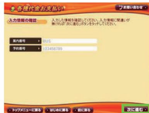
7: 入力情報に間違いがないか確認後「次に進む」をタッチ