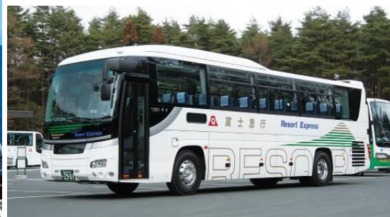
運行車両(上:京成バス 下:富士急行観光)

これは、夏季の行楽シーズンを迎え、国内外からの需要が高まりつつある「富士山・河口湖」方面への高速バスについて、更なる利便性向上と利用促進を図るため、路線の再編を行うものです。